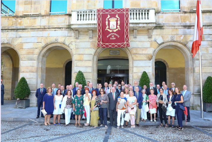
Participantes en los “Encuentros con los Graduados en Ingeniería de la rama industrial e Ingenieros Técnicos Industriales”, en la recepción ofrecida por el Ayuntamiento de Gijón, el pasado 10 de agosto.

Un año más, la ciudad de Gijón acogió, del 9 al 11 de agosto, el principal foro de la Ingeniería Técnica Industrial, que reunió a los decanos de los Colegios de Graduados en Ingeniería de la rama industrial e Ingenieros Técnicos Industriales de toda España, así como a destacadas personalidades, en el marco de los tradicionales “Encuentros”, organizados por el Colegio del Principado de Asturias.